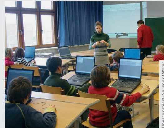
Unesco project: Sounds of Water

Zum Studium Auf der Basis von persönlichen Gestaltungserfahrungen, welche durch das Studium kontinuierlich erworben werden und der fachwissenschaftlichen Auseinandersetzung mit den Bereichen Kunst, Kultur, Medien und Pädagogik werden Qualifikationen erlangt, die zur Planung und Durchführung von Unterricht in Bildnerischer Erziehung befähigen.