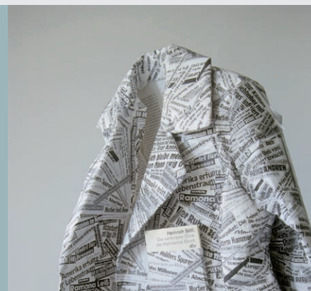
Ausstellung W 592, Linz