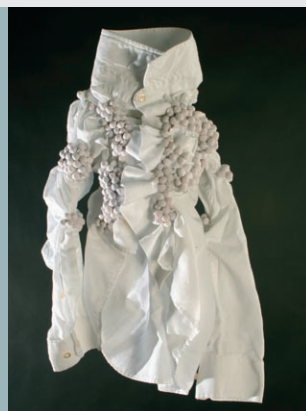
Ausstellung „... u.a. weiße Hemden“, Mondsee