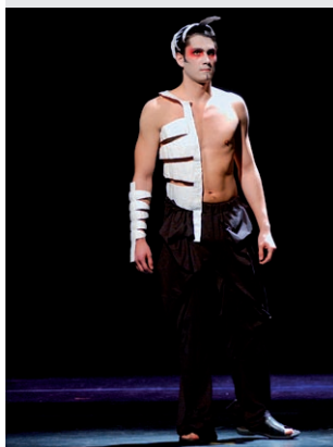
Projekt Grenzen, Linz/Wien

We are happy to counsel all persons interested in this curriculum and to show you around our department. Please make an appointment by contacting the art education curriculum Textile Design at ++43 70 7898 381 or e-mail: julia.hasenberger@ufg.ac.at