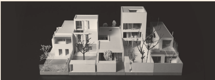
Häuser <100. Minimaltypen für verdichtetes Wohnen. Semesterthema 2007.

Temporary pavilion at the "Alter Markt" in Linz. Project 2007. Computerrendering. Johannes Derntl