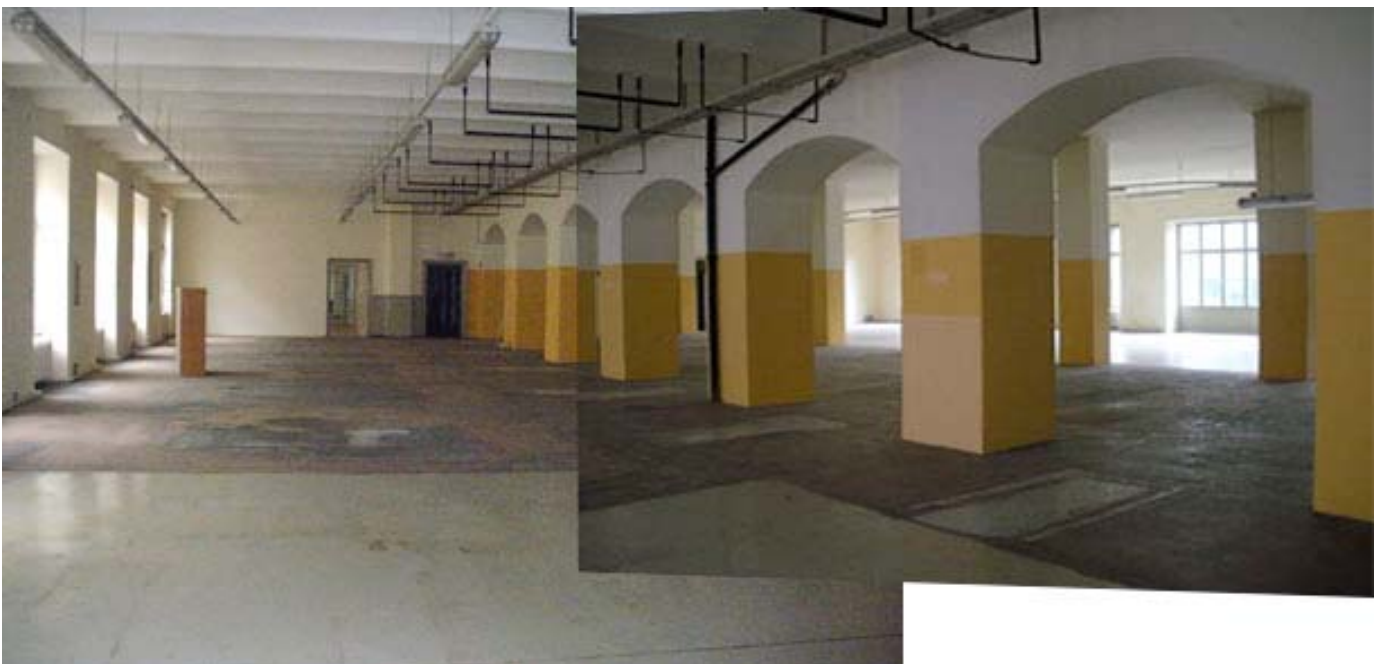
ehemaliger Druckereisaal, ca 800qm