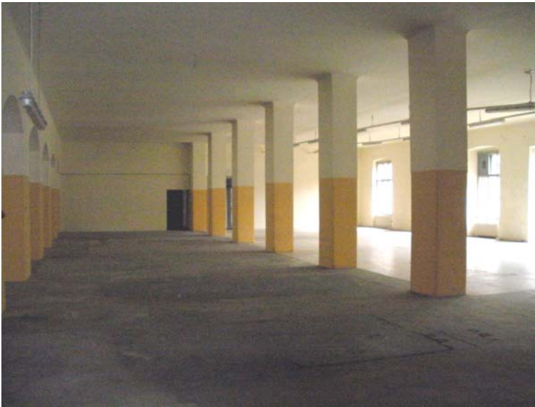
ehemaliger Druckereisaal, ca 800qm