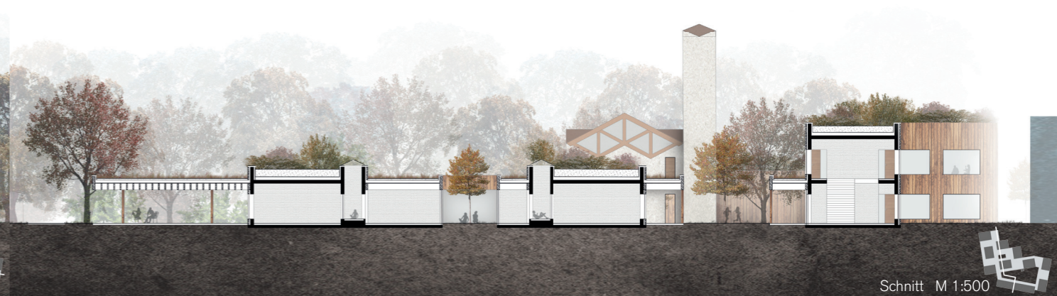
Schnitt M 1:500