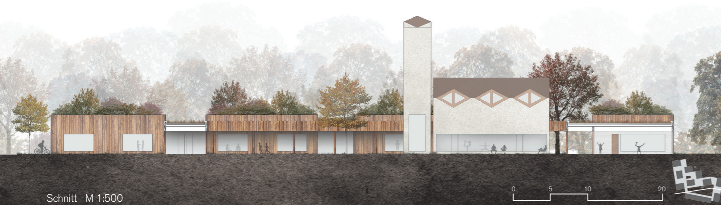
Schnitt M 1:500